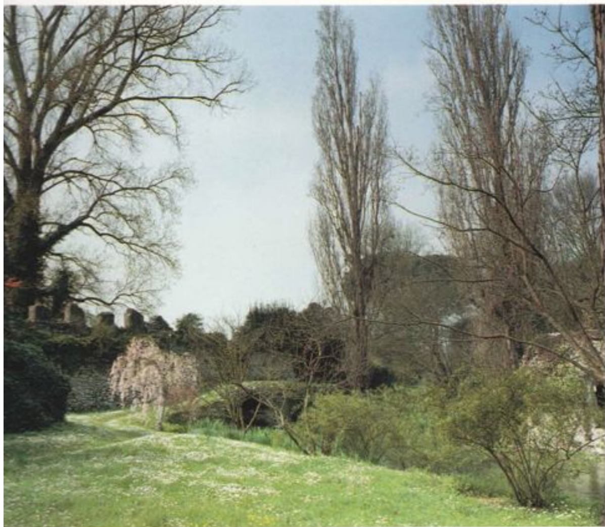
30. Primavera. A sinistra Milvus 'Profusion' è cupo nella sua scurissima fioritura cremisi. Al centro Prúnus subhirtella pëndula è luminosamente in fiore. Le margherite del prato contribuiscono ad illuminare il centro della foto. I primi germogli sui pioppi rendono le loro figure più visibili. Sullo sfondo si distinguono bene le sagome del muro e del Ponte del Macello.