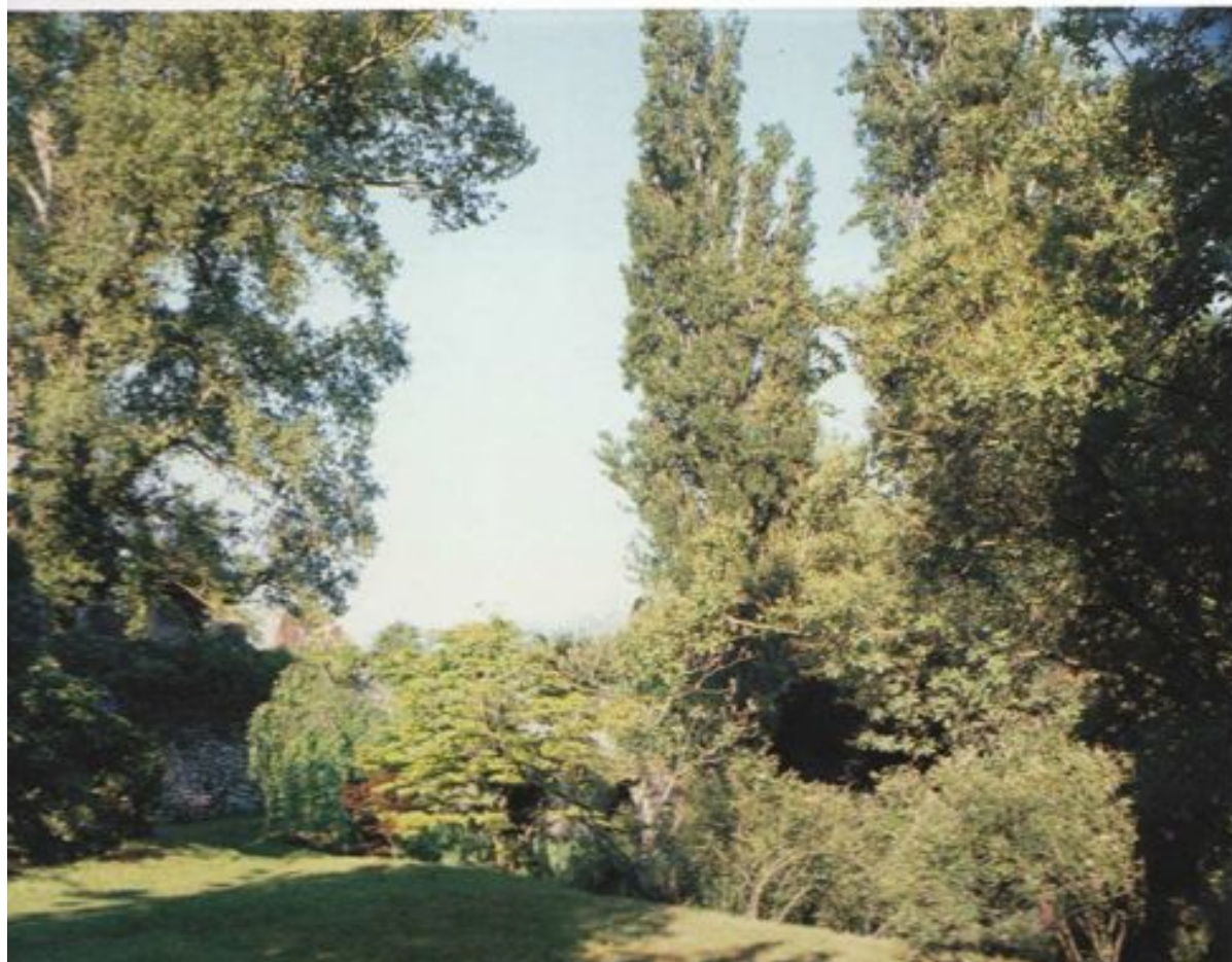
31. Estate. Tutto è verde, vegetato. Sono scomparsi il muro, e il ponte. Lo spazio si è come ristretto e si pongono in risalto solo i primi piani. Infatti nella piena vegetazione le profondità si appiattiscono, perché le trasparenze, che svelano gli altri piani, vengono a mancare. Anche la luce è meno limpida.